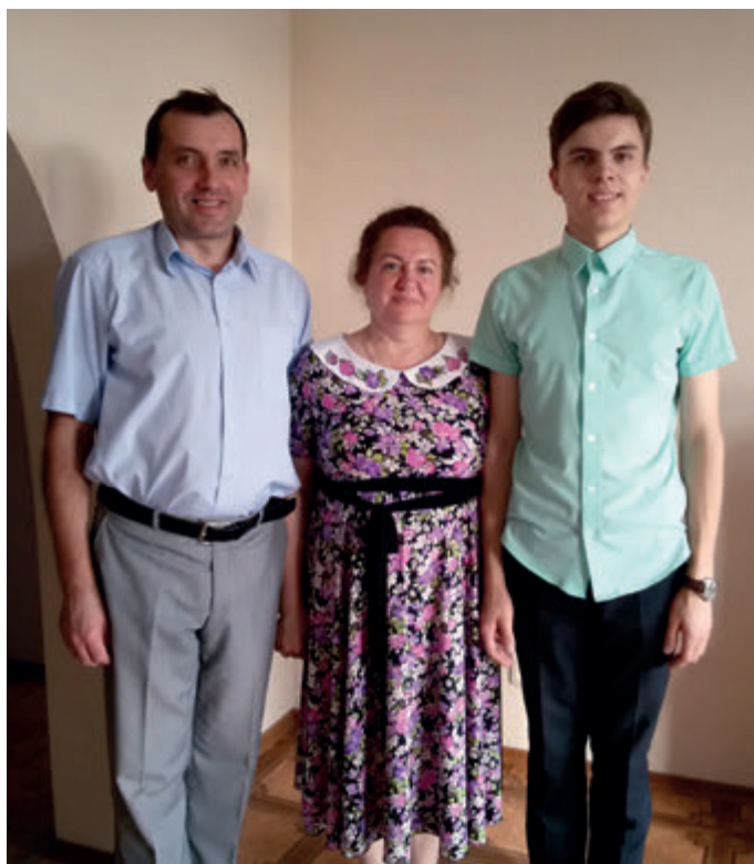
С родителями перед поступлением в вуз