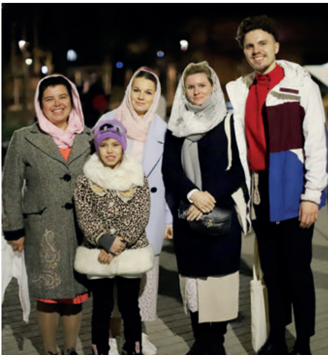
Пасха, 2022 год