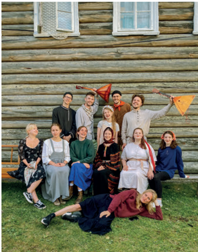
В фольклорном лагере «Фолк кемп», 2022 год