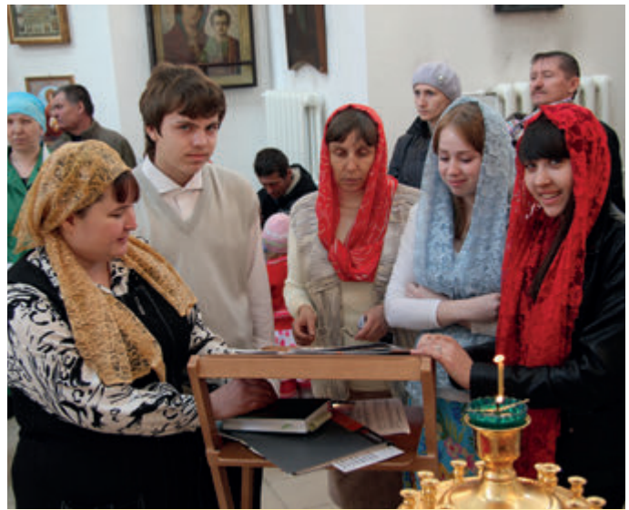
Клирос храма Даниила Ачинского, 2012 год

– Интересно, что, когда я начал ходить в храм, как будто двери открылись, и дальше все стало для меня естественно. Был, конечно, период неофитства. Помню один забавный разговор с двоюродной сестрой. Во время святков батюшка говорил, что можно причащаться даже без поста, а я к тому моменту сам еще буквально несколько раз приступал к Таинству Причащения. И вот я, совершенный неофит, говорю совершенно невоцерковленной сестре: «Пойдем в храм! Представляешь, можно причащаться абсолютно без всяких препятствий!» Она не возражала, просто выслушала, но сейчас я понимаю, насколько это