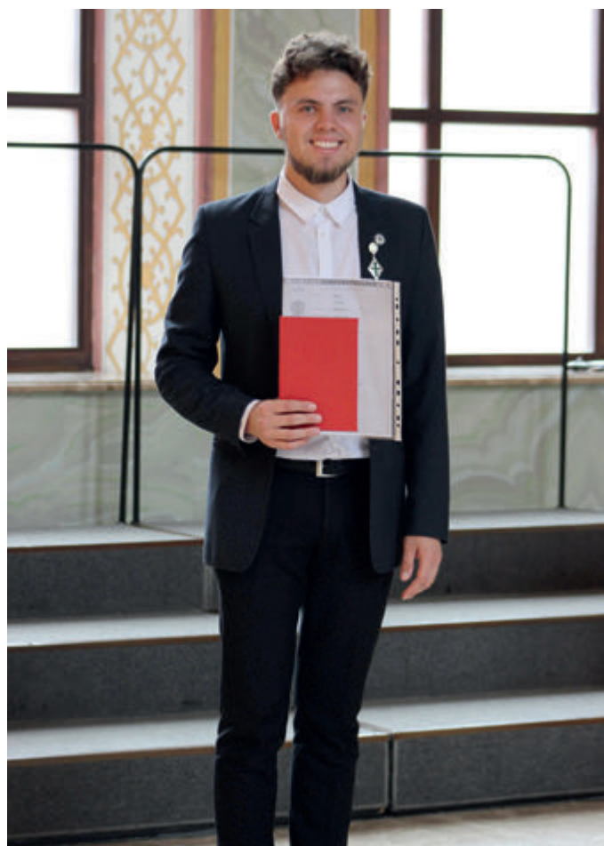
После вручения дипломов, 2019 год

– Господь говорит: «Что делаете ближнему – то делаете Мне» (Мф.25, 40). То есть из Евангелия мы знаем, что любой человек – это практически рядом с нами пребывающий Бог. Человек – это образ и подобие Божие, и поэтому каждый заслуживает внимания и особого отношения к себе с нашей стороны.